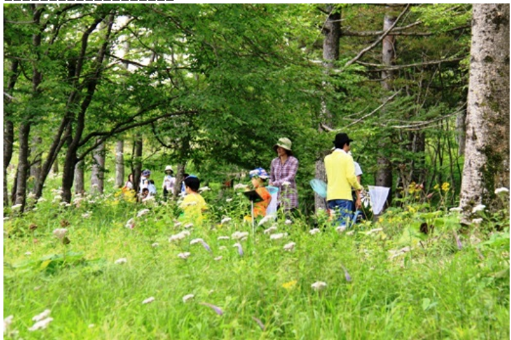
花の畑を歩いている人々